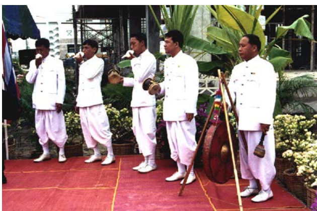
ภาพที่ 3 วงประโคมของพราหมณ์

ส่วนในพิธีวงศิลาฤกษ์อาคารศูนย์ศาสนศึกษา มหาวิทยาลัยมหิดล วงแตรสังข์จะปรับเปลี่ยนใช้เครื่องดนตรีบางชิ้นโดยปรับเอามโหระทึกและแตรรองออกไป คงไว้แต่ซ้องชัย และ สังข์ และเพิ่มเครื่องดนตรีชิ้นอื่นเข้ามาบรรเลงด้วย ได้แก่บัณเฑาะว์ และเรียกวงประเภทนี้ว่า “วงประโคม” วงแตรจะมีปรากฏร่วมอยู่ในพิธีด้วย เมื่อมีเจ้านายเชื้อพระวงศ์เสด็จ